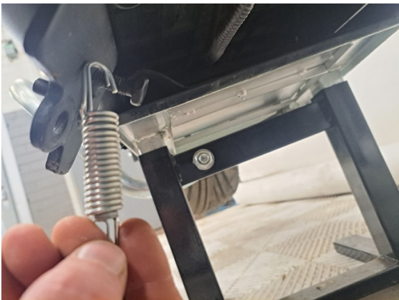
Ota jalkatuen jouset pois.